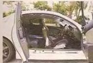
▲RX-8用上四門對門式設計，後座亦不上落更輕鬆。