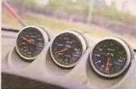
▲車廂內更加設了三種不同油溫、油壓及排溫儀表，以助監測行車狀況。