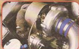
▲整套SFR Turbo Kit當中包括一隻非常巨大的T-4型大渦輪、46mm Wastegate、前置式Inter-cooler等。