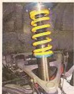
▲懸掛系統用上意定型Endless Zeal Function Xs絞牙避震機。