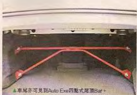
▲車尾亦可見到Auto Exe四點式尾頂Bar。