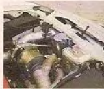
▲原裝空、燃油增加可改裝成更強勁的動力，引擎亦更強勁。