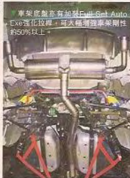
▲車架底盤亦有加裝Evo-6 Bolt Auto Exe強化拉桿，可大極增強車架剛性的50%以上。

一向專營汽車改裝的Phillip Yau，近年不斷引入歐、美、日著名改裝部件來港，以迎合各類型改裝車需要。就如今次介紹的Turbo RX-8，為了進一步提升RX-8馬力輸出，特別為13B-MSP自然吸氣轉子引擎注入一套美國製Bolt-on式SFR Turbo Kit，將原有250ps的最大馬力增至380ps上限，令轉子引擎極限釋放出來！