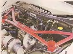
▲四點式Auto Exe頂頂Bar，大大提升RX-8車架剛性。